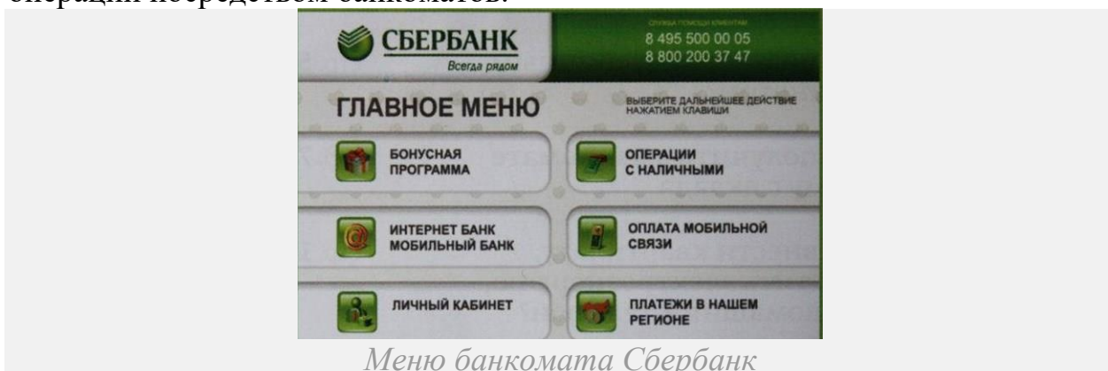
Меню банкомата Сбербанк

Если планируете оплатить с карточки — вставьте ее в специальное отделение и введите пин-код, как вы обычно делаете при совершении финансовых операций посредством банкоматов.